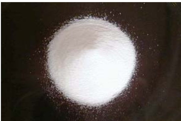
倍率 × 1