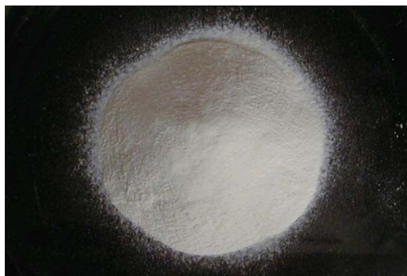
倍率 \times 1