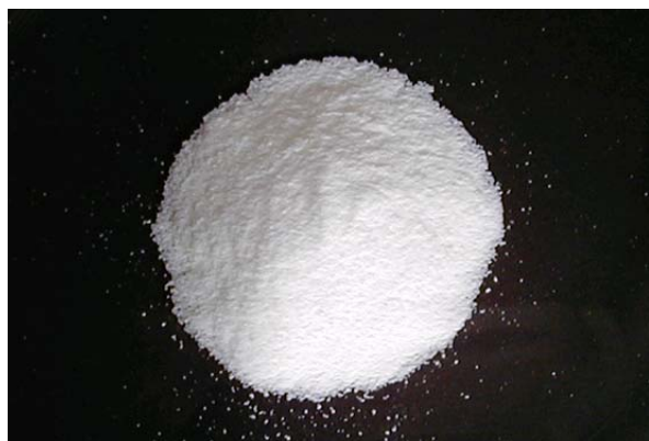
倍率 \times 1