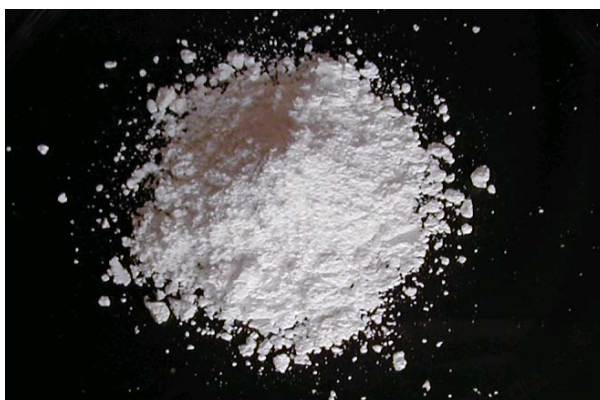
倍率 \times 1