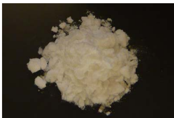
倍率 × 1