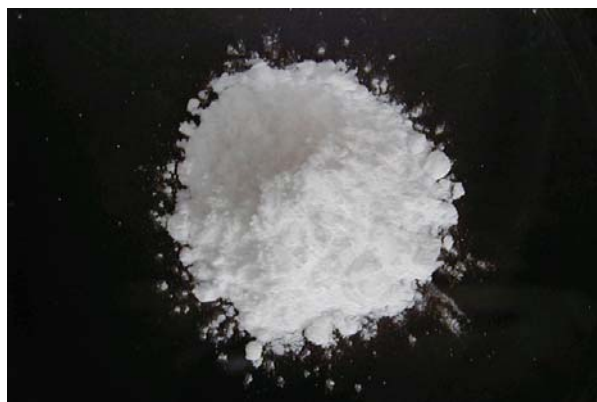
倍率 \times 1