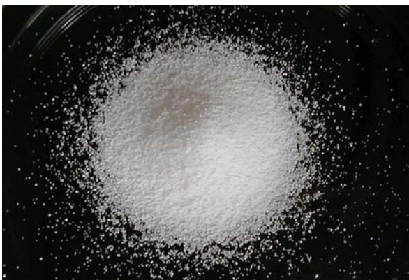
倍率 \times 1