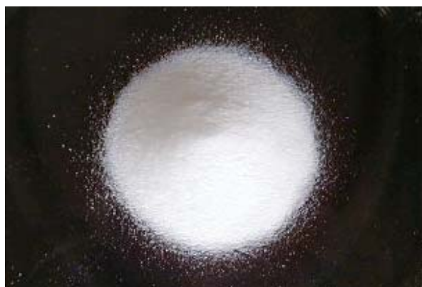
倍率 \times 1