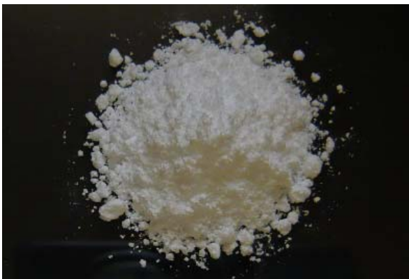
倍率 × 1