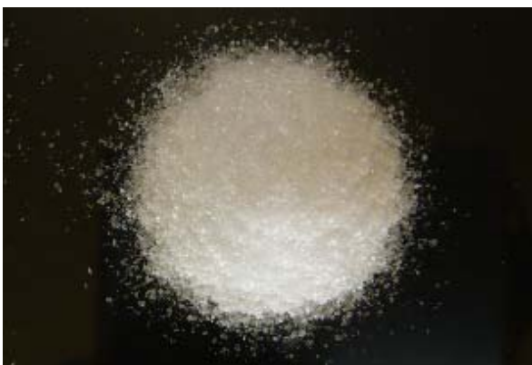
倍率 × 1