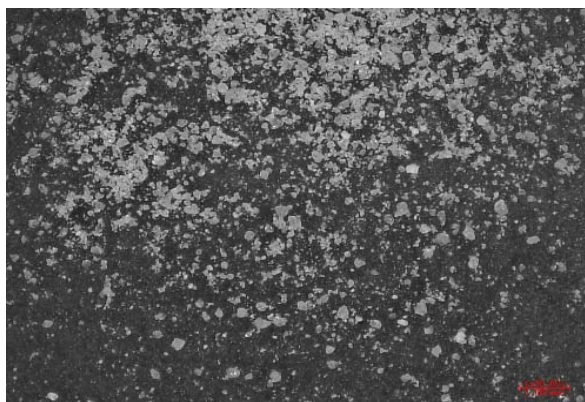
倍率 \times 30