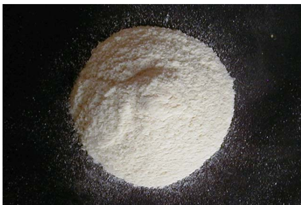
倍率 \times 1