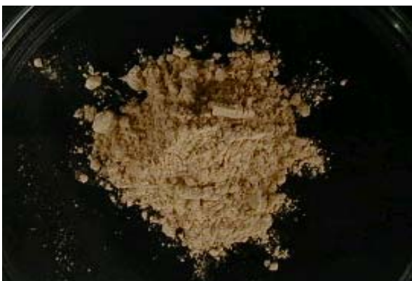
倍率 \times 1