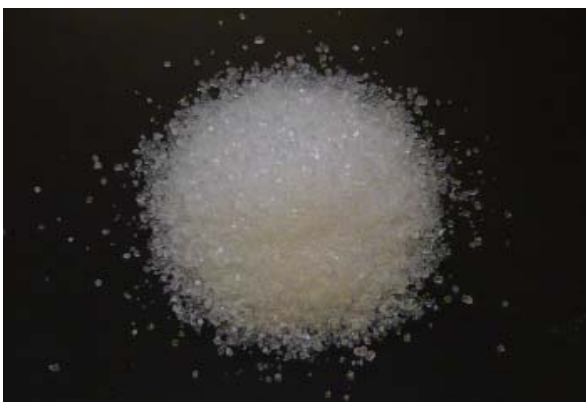
倍率 × 1